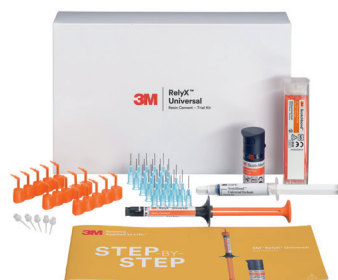
3M™ RelyX™ Universal Resin Cement Trial Kit TR (56969)