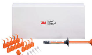
3M™ RelyX™ Universal Resin Cement Refill TR (56971)