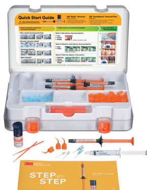
3M™ RelyX™ Universal Resin Cement Intro Kit (56968)