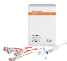
3M™ Scotchbond™ Universal Plus Adhesive Unit Dose 100 L-Pop™ (41298)